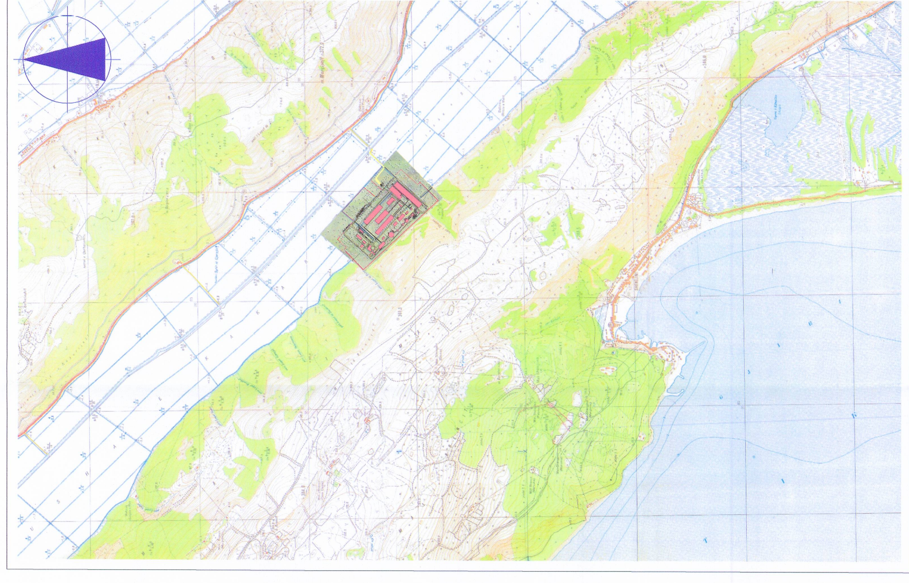
SKEMA E VENDOSJES SE STUDIMIT NE RAJON SH 1:20000